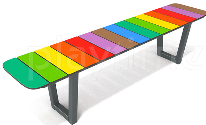
Widok z boku