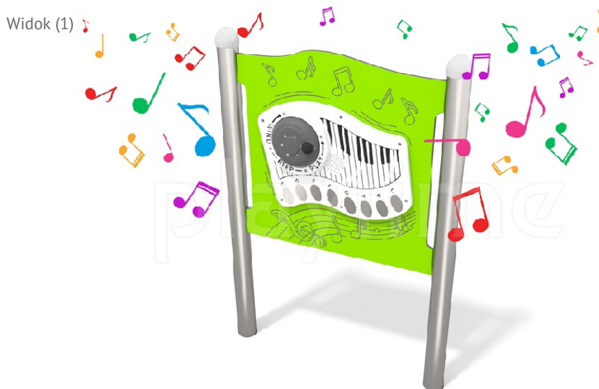
Widok z boku