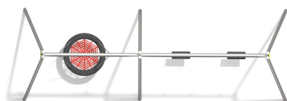
Widok z boku