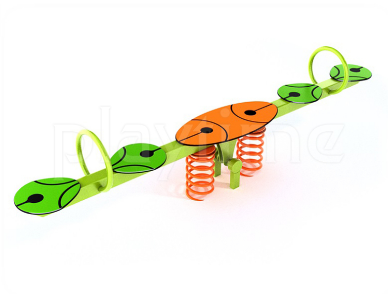
Widok z boku