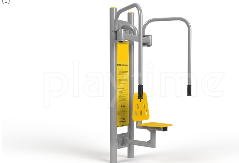
Widok z boku