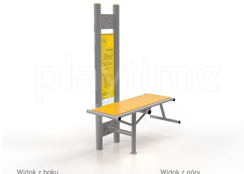
Widok z boku