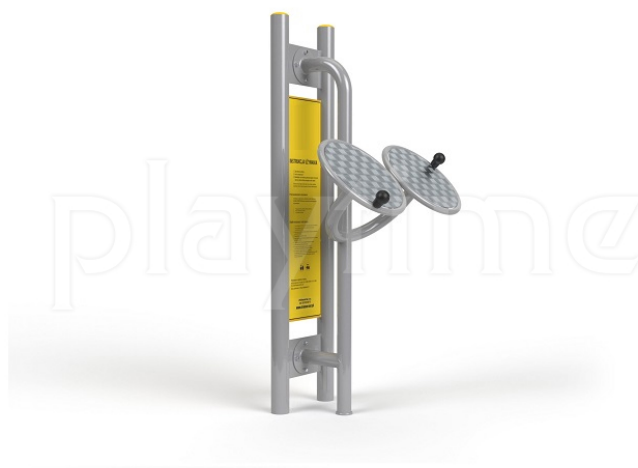
Widok z boku