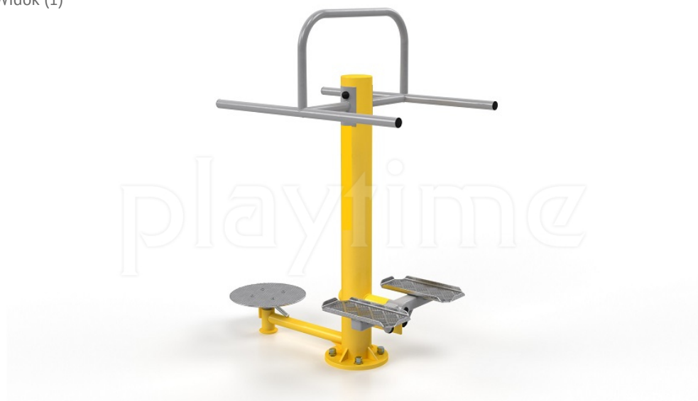
Widok z boku