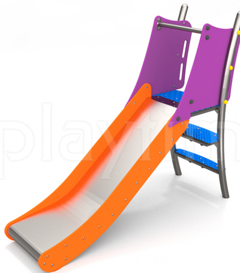
Widok z boku