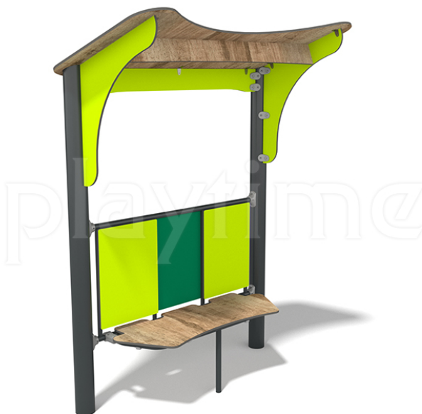
Widok z boku