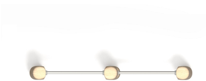
Widok z boku