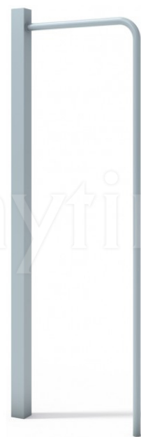
Widok z góry