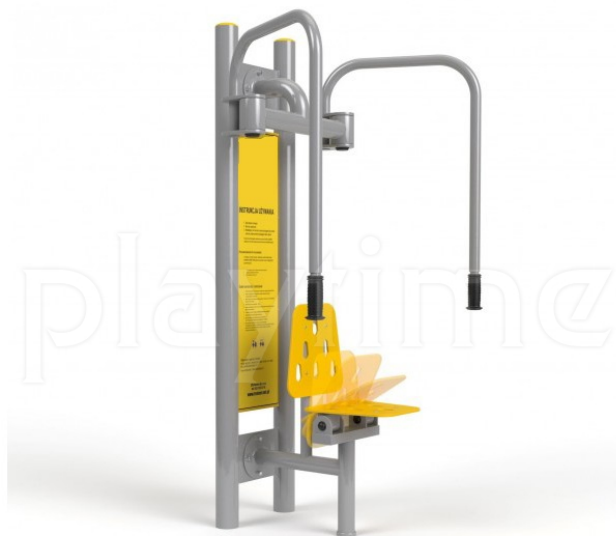
Widok z boku