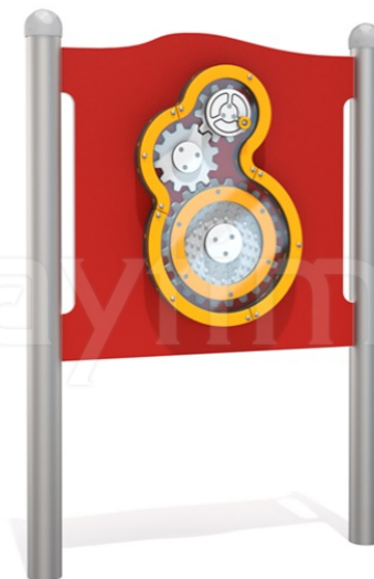
Widok z boku