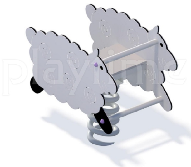
Widok z góry