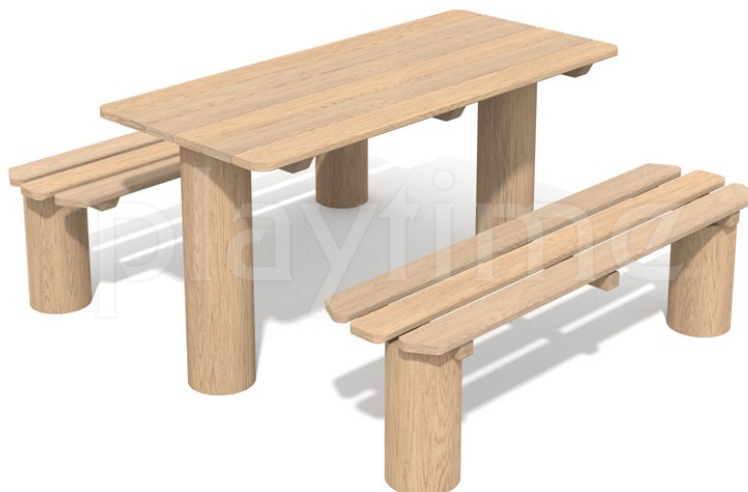
Widok z boku