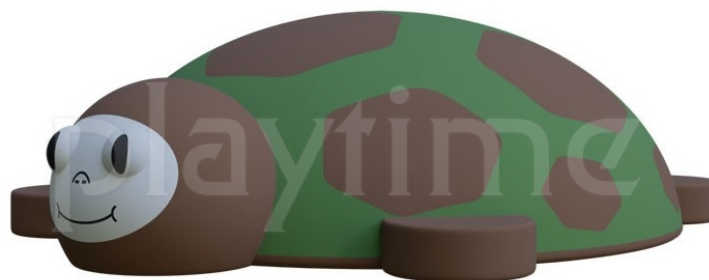
Widok z boku