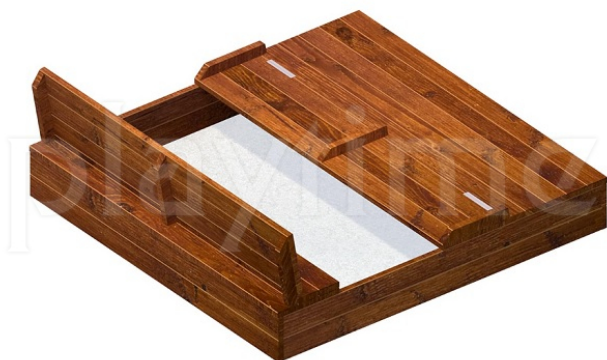
Widok z góry