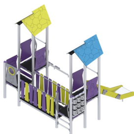
Widok z góry