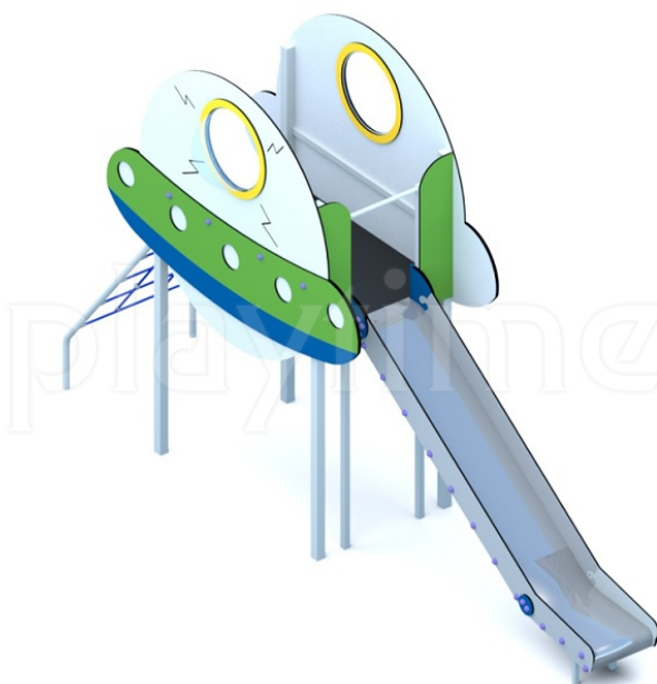
Widok z góry