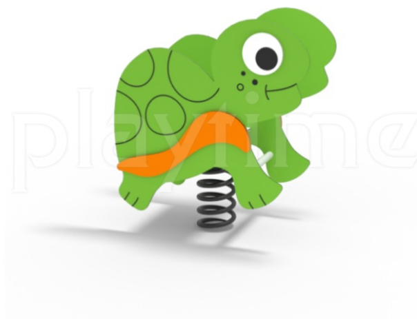
Widok z góry