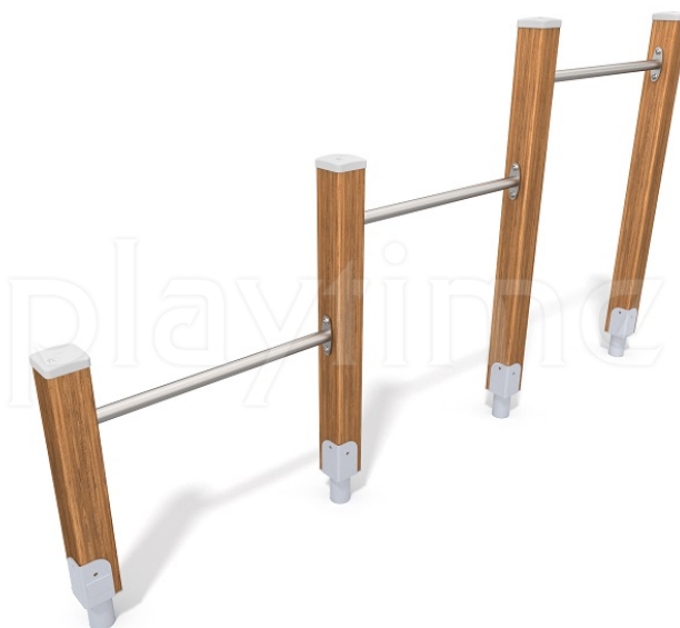
Widok z boku